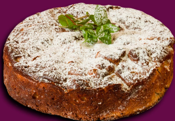
39. Šakočio pyragas