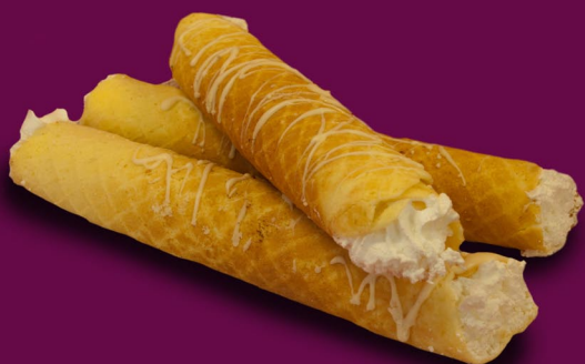
56. Vamzdelis su įdaru