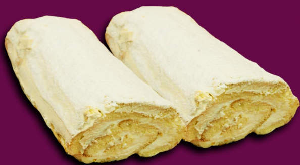
55. Pyragas su varške