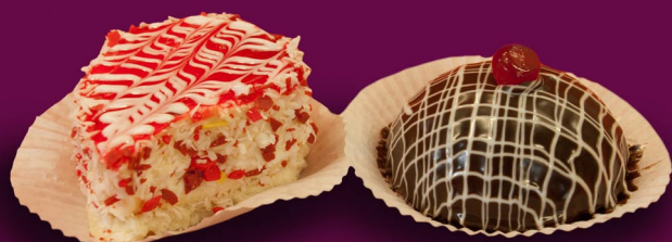
58. Pyragaičiai su paukščių