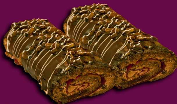
59. Šokoladinis vyniotinis