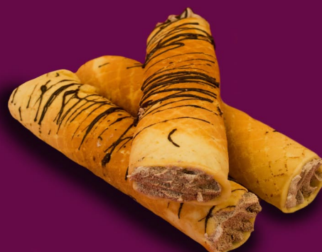
61. Vamzdelis su šokoladiniu įdaru