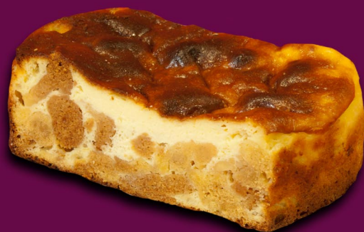
43. Šakočio pyragas